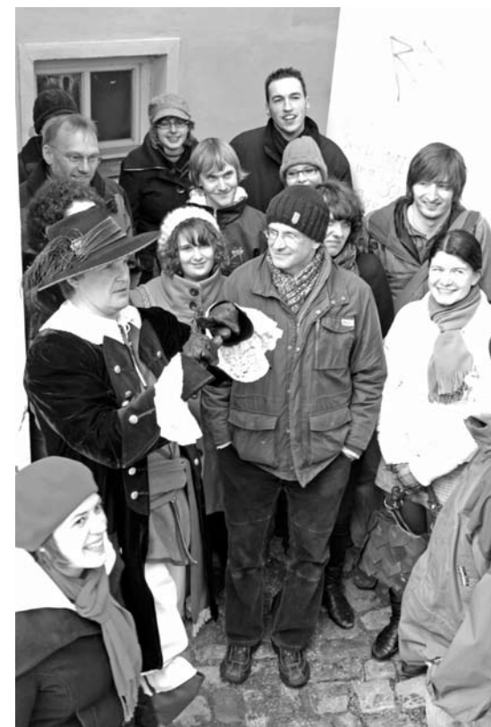
Historische Stadtführung mit einem Passauer Edelmann