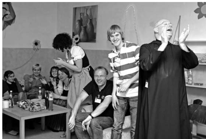
Göttliche Gaudi: Nach konzentrierten Diskussionen und intensivem Studienteil genießen die Delegierten einen lustigen Abend