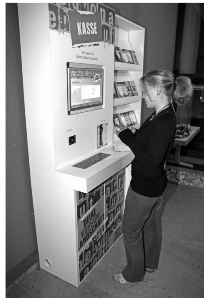
Die Ausstellung „Deine Konsumlandschaft“ des Bundesverbandes der Regionalbewegung feiert auf der Konferenz ihre Premiere