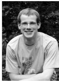
Dieser Weg wird kein leichter sein

Seit geraumer Zeit wird in Politik und Gesellschaft das Thema „Schule“ diskutiert. Viele verschiedene Facetten wurden beleuchtet, aber irgendwie geht es nur schleppend voran. Ist der Weg so steinig und schwer? Die KLJB Bayern jedenfalls hat sich auf ihrem Landesausschuss zum Thema positioniert.