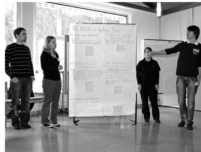
Zum Abschluss präsentieren die Teilnehmer den Politikern ihre Ergebnisse

Der ländliche Raum bietet einzigartige natürliche Ressourcen, die die Grundlage u.a. für die Landwirtschaft und den Tourismus bilden. Dies ist eine seiner Stärken, aber nicht seine einzige. Die Menschen mit ihrem Engagement und ihren Fähigkeiten sind ein großes Kapital. Viele Dorfgemeinschaften sind von Vernetzung und Zusammenarbeit geprägt. Ohne bürgerschaftliches Engagement würde in den Dörfern und Gemeinden nichts laufen!