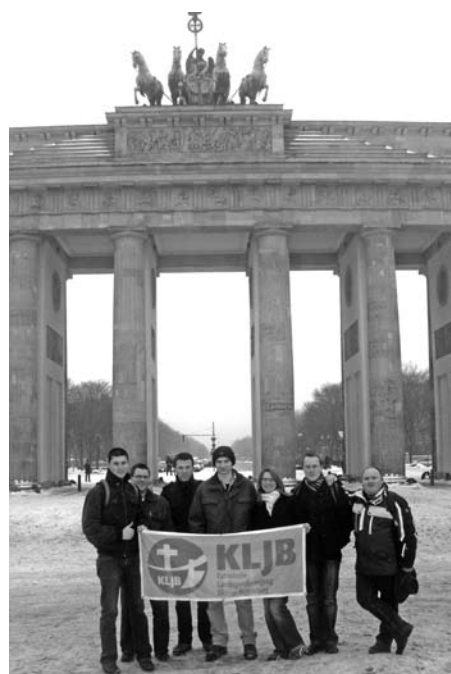
Brandenburger Tor statt Steinerne Brücke – die KLJB Regensburg erkundet die Hauptstadt

Am 14. Januar machten sich 40 Landjugendliche aus der gesamten Diözese Regensburg auf den Weg zur größten Verbrauchermesse der Welt. Am Freitag besichtigten die Jugendlichen das Bundespräsidialamt und das Schloss Bellevue. Danach konnten sie sich bei einer Stadtrundfahrt mit unserer Hauptstadt, ihrer Geschichte und ihrer Kultur vertraut machen. Am Abend trafen sich interessierte KLJB'ler aus dem gesamten Bundesgebiet, um sich über die „Situation und Zukunft der Landwirtschaft“ auszutauschen. Hier war insbesondere die Nord-Süd-Debatte sehr interessant.