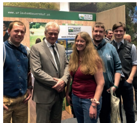
Bundeslandwirtschaftsminister Alois Rainer eröffnet die „Grüne Woche 2026“.