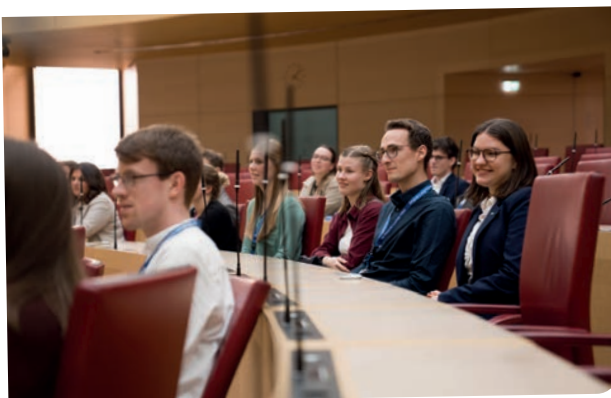
Die Abgeordneten von morgen...?