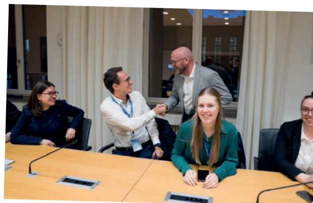
Der Bayerische Digitalminister Fabian Mehring begrüßt die Teilnehmenden.