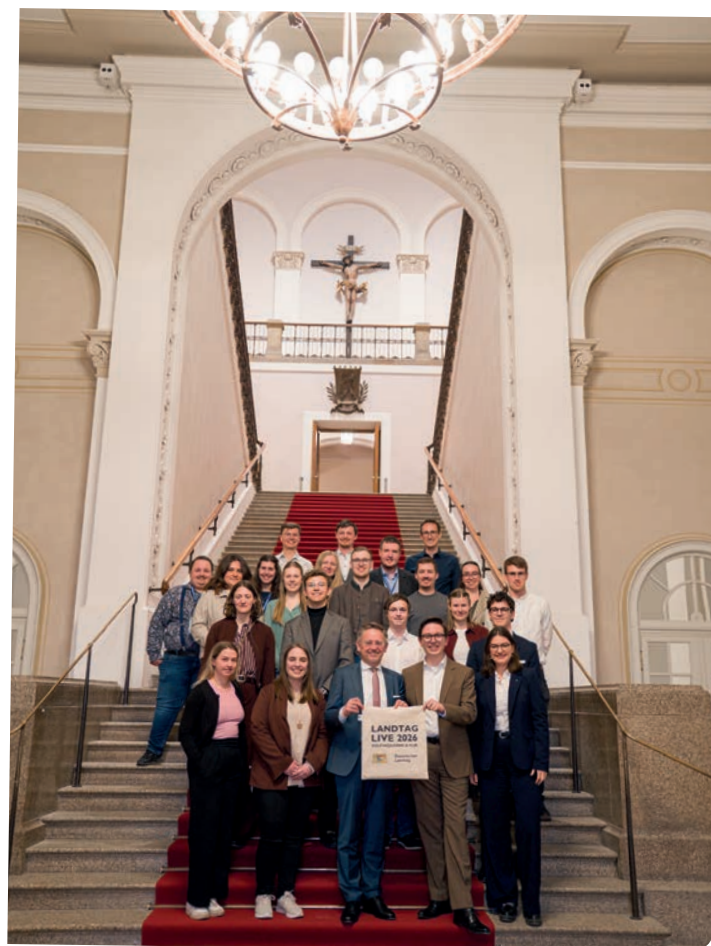
Alle Teilnehmenden von Landtag Live