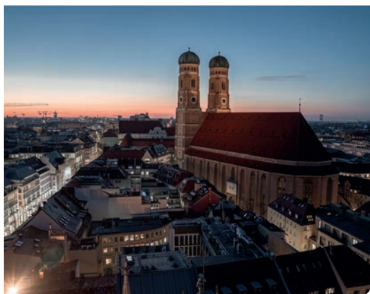
Diese tolle Aussicht über München ergab sich bei der Führung durch das Münchner Rathaus.

Vom 8. bis 13. März fand erneut gemeinsam mit der Kolpingjugend Bayern die politische Praxiswoche „Landtag Live“ statt. 18 junge Erwachsene erhielten dabei die Möglichkeit, eine Woche lang hautnah Einblicke in das politische Geschehen in München zu gewinnen.