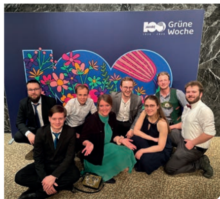
KLJB München und Freising: Die Gruppe der „langen Fahrt“ beim BDL-Landjugendball.