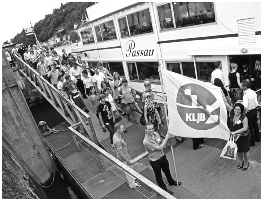
Ganz bewusst feierte die KLJB Passau ihr 60jähriges Jubiläum auf der Donau: Hier begrüßen der Diözesanvorsitzende Roland Paintmayer und die ehemalige Diözesanvorsitzende Daniela Wimmer die Gäste zu einer Fahrt durch den betroffenen Abschnitt

stauen das Wasser auf, ohne den Fließcharakter des Flusses zu hemmen. Zahlreiche öffentliche Gutachten zeigen, dass dieser Ausbau für die Schifffahrt vollkommen ausreicht und ökonomisch der einzig sinnvolle Weg ist. Er kostet einen Bruchteil des Staustufen-Ausbaus.