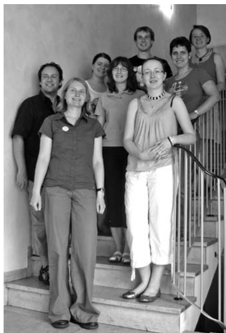
Der AK Glaube und Leben bei seinem Treffen in der Pfarrei St. Karl in Nürnberg

Bei seinem Treffen Anfang Juli konnte der AK Glaube und Leben auf ein sehr erfolgreiches erstes Jahr zurückblicken. Besonders gut bewerteten die AK-Mitglieder die Auseinandersetzung mit dem Thema „Landpastoral“ und die damit zusammenhängende Erarbeitung des Studienteils auf der Landesversamm-