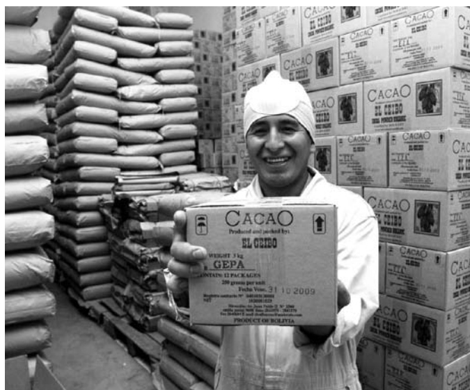
Dank Fairem Handel: Ein zufriedener Mitarbeiter der bolivianischen Kakaogenossenschaft El Ceibo präsentiert verpacktes Kakaopulver

Verbesserung der Situation beitragen, indem sie den Fairen Handel unterstützen und sich mit regionalen und ökologischen Lebensmitteln versorgen.