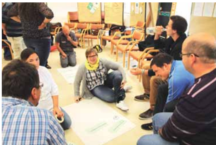
Wichtiger Teil bei unserer gemeinsamen Tagung: Was gibt es Neues aus den Diözesen Bayerns in der KLJB? Hier überlegt die KLJB Würzburg, was für alle anderen wichtig zu wissen ist.