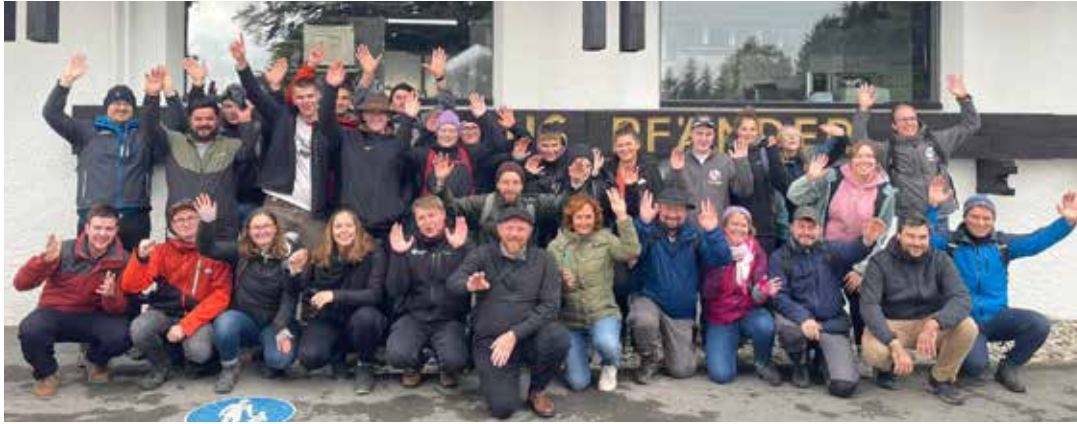
Zusammen mit dem Diözesanteam waren KLJBler*innen aus Nassenfels, Kaldorf, Wachenzell, Seubersdorf und Deining unterwegs.

dort aber vom Aussterben bedroht sind, leben hier wie in freier Wildbahn – nur ohne natürliche Fressfeinde. Wir bestaunten kleine Affenfamilien, beobachteten die Rangordnung unter den Tieren bei der Fütterung und schossen Fotos von und mit Affen. Keine Affen, aber unter anderem Hirsche, Wölfe und Wildschweine erwarteten uns am Sonntag in Allensbach. Hier wurden wir fachkundig durch ein Wildgehege mit freilaufenden weißen Hirschen geführt. In Sachen Wildtier macht uns so schnell keiner mehr was vor! Auch am Samstag auf dem Pfänder in Bregenz, einem Berg auf der österreichischen Seite des Bodensees, begegneten wir Steinböcken und Mufflons. Die Murmeltiere murmelten sich leider vor uns ein. Der eigentliche Grund für unseren Besuch hier waren aber eine Kräuterwanderung und eine Führung mit Informationen zur Geologie des Berges. Wir wissen jetzt, wie die Alpen entstanden sind, und bringen einige Tipps für die Hausmedizin mit nach Eichstätt zurück.