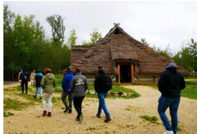
Campus Galli: So müssen Häuser im 9. Jahrhundert ausgesehen haben. Die anderen Bilder vlt. einfach als Fotoseite ohne Unterschriften anordnen?