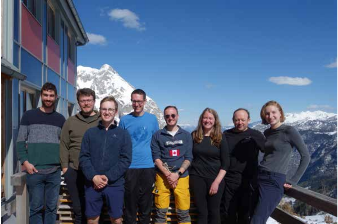
Gruppenbild bei der AK-Klausur im April 2024 auf dem Carl-von-Stahl Haus im Berchtesgardener Land.