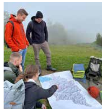
Auf der Karte sehen wir, wie sich die Berge im Laufe der Jahrtausende verändert haben.