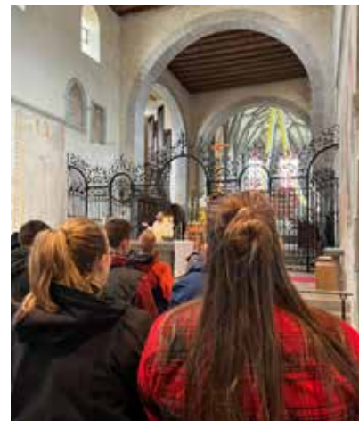
Die Fahrt beginnt mit einem Gottesdienst im Münster Reichenau.

Willkommen am Affenberg in Salem, im Alpenwildpark auf dem Pfänder in Bregenz und im Freizeit- und Wildpark in Allensbach. Während dieser Studienfahrt war kein wildes Tier vor uns sicher. Den Affenberg in Salem erkundeten wir Donnerstagnachmittag in Kleingruppen. Die Mitarbeitenden erklärten uns das dahinterstehende Konzept: Die Berberaffen, die eigentlich in Nordafrika leben,