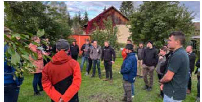
Ein Garten voller Obstbäume. Hier wachsen die Früchte, die später zu Schnaps verarbeitet werden.

Und wir haben noch mehr im Gepäck: köstliches Tafelobst und edle Tropfen. Hop-on–Hop-off: Brennerei „Brennluft“ und „Lindenwirts“, Hof mit Direktvermarktung. Natürlich schlug unser Landjugendherz auch auf der Studienfahrt für die Landwirtschaft. Gleich zwei Höfe durften wir uns am Samstagnachmittag ansehen. Hof Nr. 1 bot uns einen Einblick