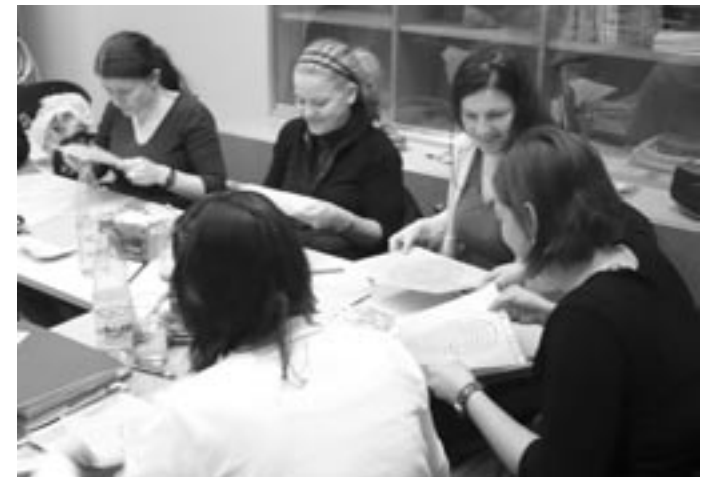
Zu Beginn des Diözesanausschusses lenkten die Delegierten einen Wassertropfen durch ein Labyrinth: eine der vielen Methoden aus der neuen religiösen Arbeitshilfe „Sonnenblume“ der KLJB Würzburg.

Erstmals traf sich die KLJB Würzburg am 18. Januar zum Diözesanausschuss an einem Abend im Winter. Damit sollen die bisherigen zwei Versammlungen im Frühjahr und Herbst sowie der ganz-