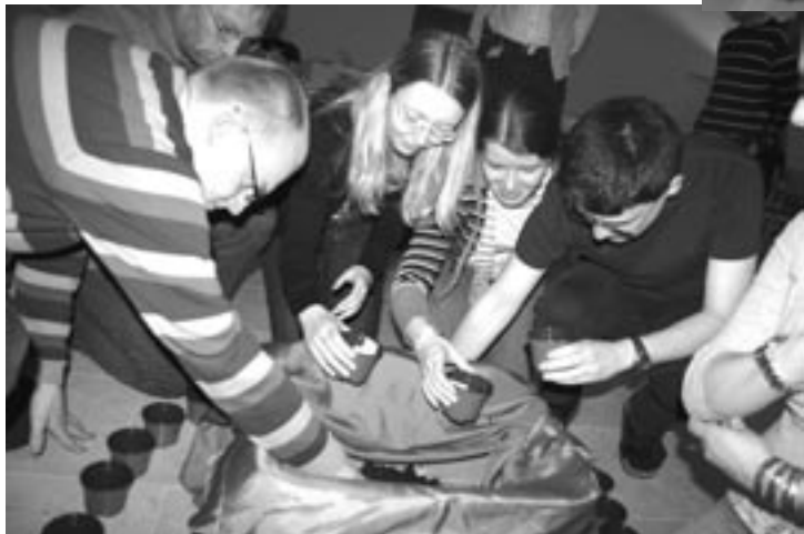
Symbol für die gemeinsame Arbeit, die Früchte trägt: Beim Gottesdienst pflanzen die Delegierten Brunnenkressesamen