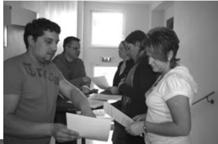
Die politische Forderungen werden diskutiert und später abgestimmt