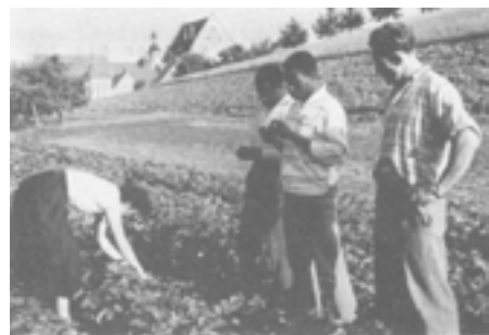
Nach dem ersten Weltkongress der MIJARC in Lourdes kamen 14 Delegierte aus Afrika nach Deutschland.