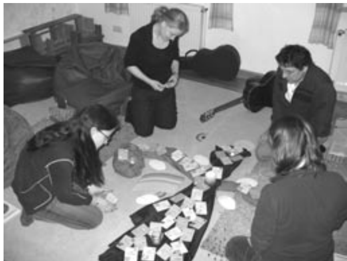
Teilnehmer/-innen der Lebensfeier wählen sich eine „Glückskarte“ aus

Einmal im Monat feiert die KLJB Würzburg eine Lebensfeier.