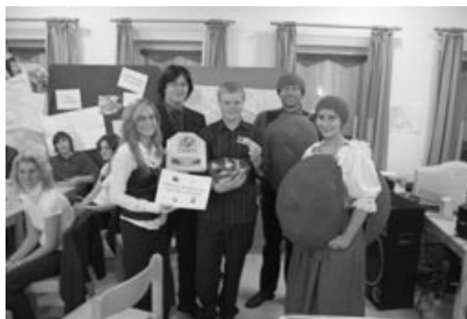
Abschluß des Heiner und Kuni Projektes mit Preisverleihung

KLJB Würzburg erweitert Zahl der diözesanen Gremien auf vier pro Jahr.