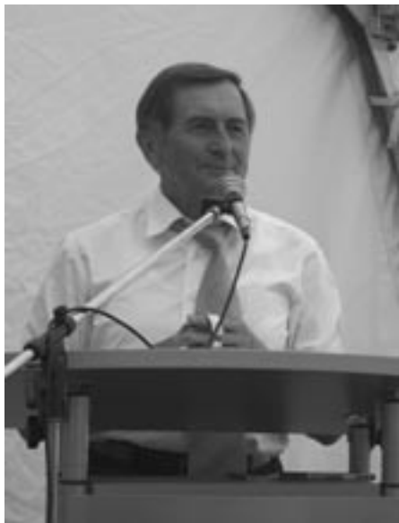
Ist erneut Schirmherr des Landjugendförderpreises: Landtagspräsident Alois Glück