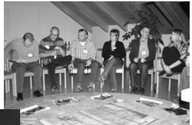
50 Jahre Partnerschaft mit der senegalesischen Landjugend - Auftakt des Jubiläumsjahres mit alten Fotos und Reiseberichten