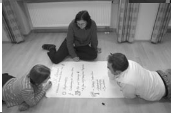
Austauschrunde: Die Diözesanverbände informieren sich gegenseitig über geplante Projekte