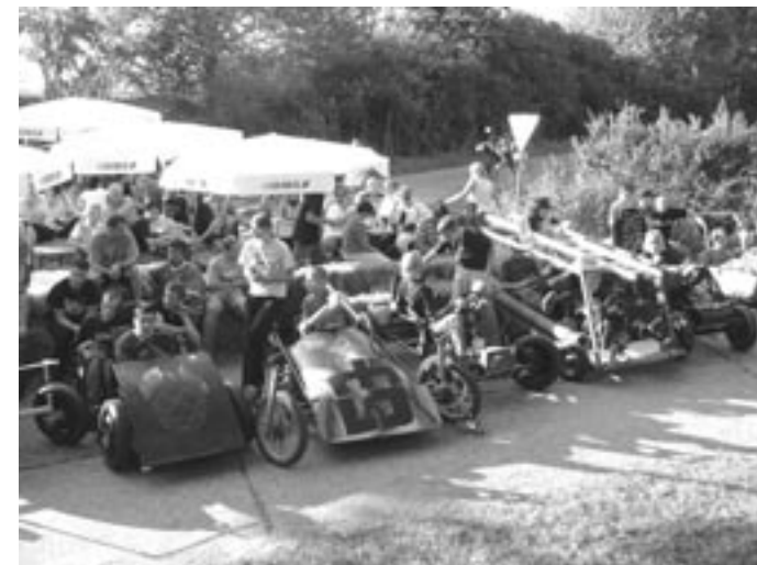
Cool Runing - Seifenkistenrennen der Evangelischen Landjugend Altersbach, Unterfranken

Unter dem Motto „Landwirtschaft voller Energie und Leben“ werden bayernweit Aktionen und Veranstaltungen zur Nachwuchswerbung für die land- und forstwirtschaftlichen Berufe sowie Aktivitäten zur Imagewerbung für den Berufsstand ausgezeichnet. Dabei sucht der Bayerische Bauernverband (BBV) vor allem nachahmenswerte Projekte, um die Öffentlichkeitsarbeit der Land- und Forstwirtschaft weiter zu verbessern. Bewerbungsfrist ist der 30. April 2008.