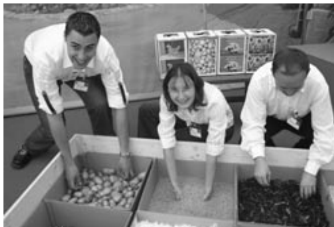
Zum Anfassen: Standbetreuer/-innen beim ZLF 2004 präsentieren den KLJB-Sinnenparcours

Wir suchen engagierte KLJBler und KLJBlerinnen, die Lust haben, mitzu-